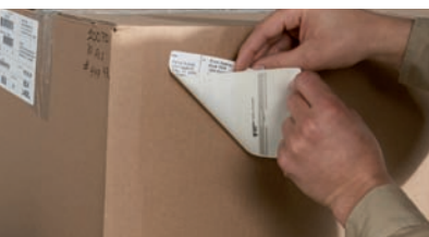
Transport und Logistik