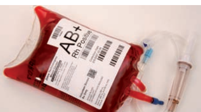
Pharma und Medizin