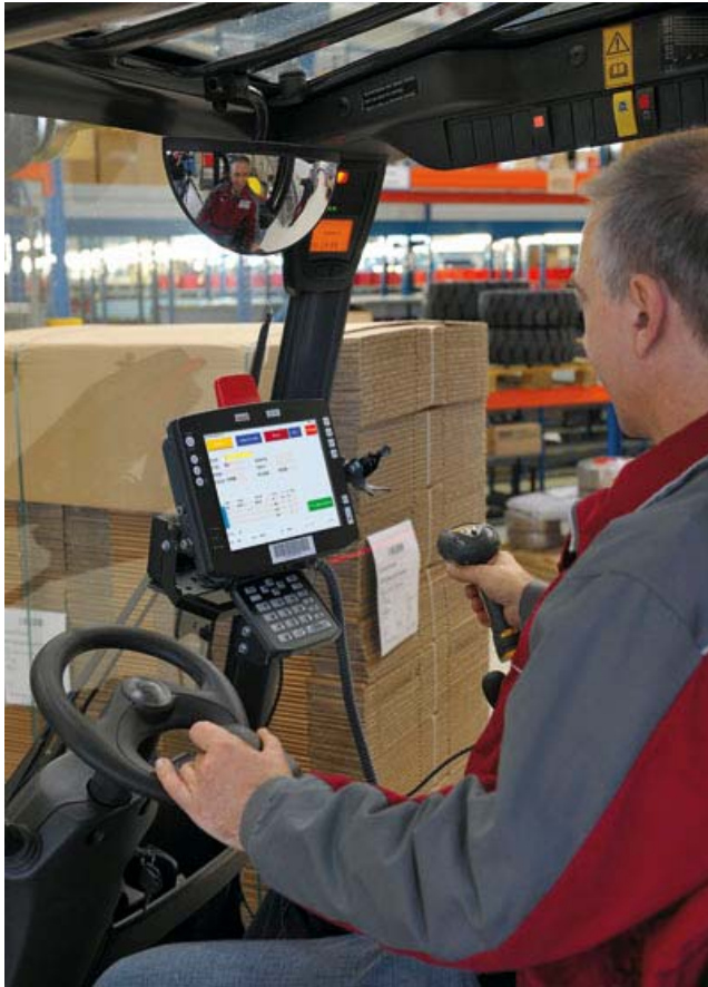
Abb. 1: Dank mobiler Dialoge direkt im SAP® ERP bearbeitet der Staplerfahrer mit dem Staplerleitsystem ICS SLS seine Fahraufträge routen- und prioritätsgesteuert. Neben der standardmäßigen Warenidentifikation per Barcodescanning realisiert ICS auch die automatische, kamerabasierte Warenidentifikation.

Bildmaterial erhalten Sie auf Anfrage an marketing@ics-ident.de