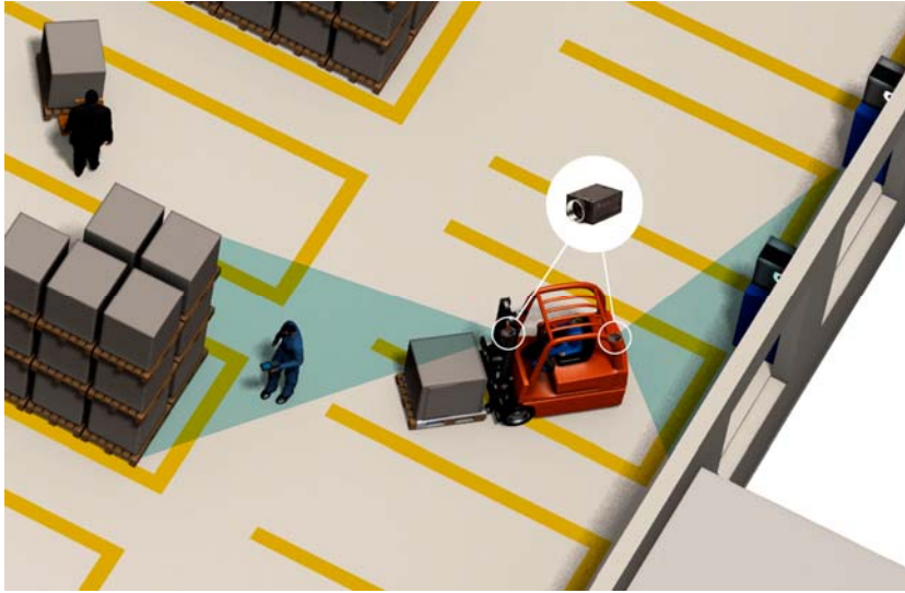
Abb. 3: ICS Stapler-Track ortet punktgenau. Fahrzeugbewegungen werden in Echtzeit transparent erfasst und für den effizienten Einsatz der Staplerflotte unter ICS SLS genutzt.