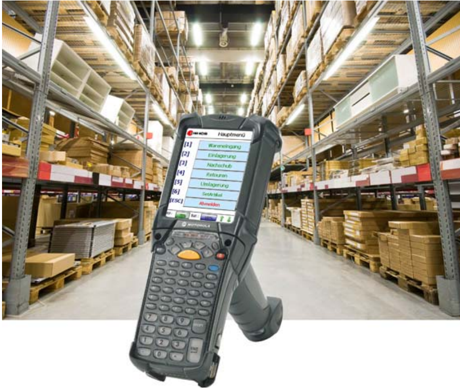
Abb. 2: Mobilität im Lager: Die Lagerverwaltungssoftware STRADIVARI WMS von ICS, hier auf dem neuen Motorola MC9190-G, überzeugt durch grafische Oberflächen und bedienerfreundliches Handling.