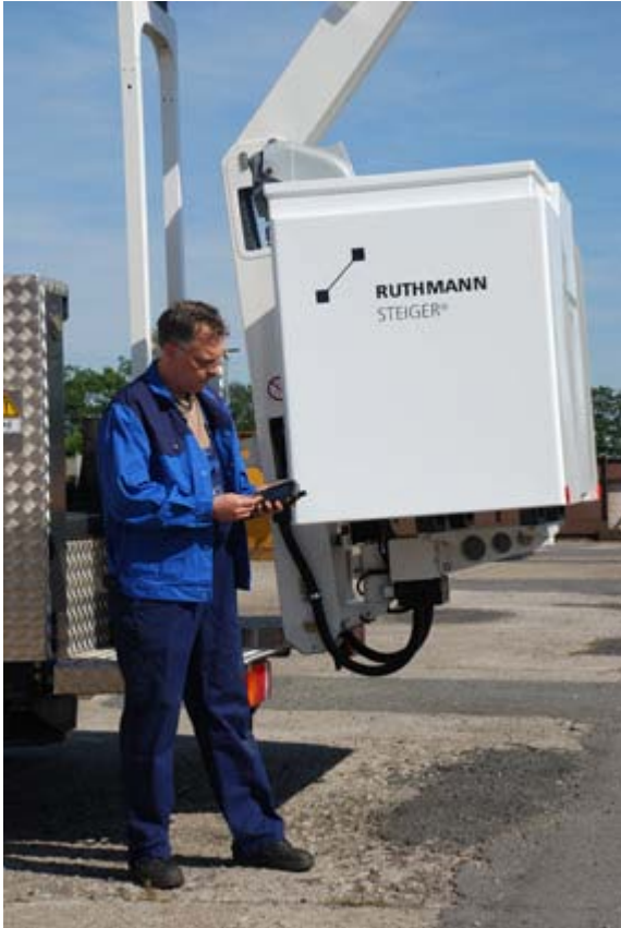
Abb. 3.: ICS-Kunde Ruthmann setzt bei der Instandhaltung seiner Steiger und Hubarbeitsbühnen auf die mobile Außendienstlösung 4mobile Service von ICS. Das projekterfahrene Systemhaus liefert von der Prozessberatung über die Konzeption, Softwareprogrammierung und ERP-Implementierung bis hin zu herstellerunabhängiger Hardware und umfassenden Support alle Leistungen aus einer Hand.