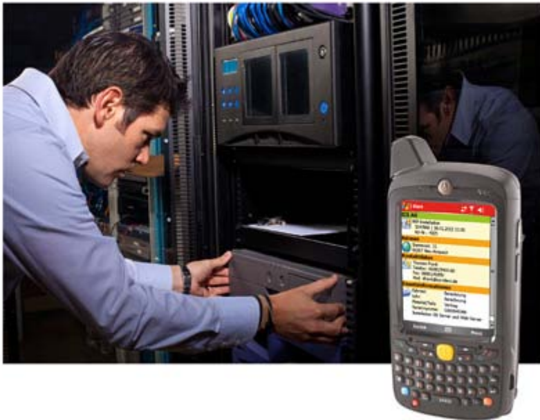
Abb. 2: Transparenz, Fehlerminimierung und deutliche Produktivitätssteigerung: Die Software 4mobile Service von ICS International, hier auf dem Motorola MC65, digitalisiert die Auftragsübermittlung und -abwicklung in Unternehmen mit Service-Außendienst. Arbeitszeiten und Aufwände können direkt vor Ort einmalig erfasst werden.