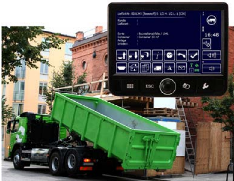
Abb. 4: 4mobile-Systemlösungen von ICS International, hier auf dem Fahrzeugfesteinbau TeleDrive ® , finden auch bei Entsorgern und Containerdiensten Anwendung, um Außendienstprozesse digital abzubilden. Zahlreiche vorkonfigurierte Softwarefunktionen, wie unter anderem mobile Auftragsabwicklung, GPS-Ortung, Geo-Koordinatendarstellung von Abfallbehältern und Containern, grafische Disposition, Tourenoptimierung und Navigation, sorgen für effiziente Prozessabläufe.