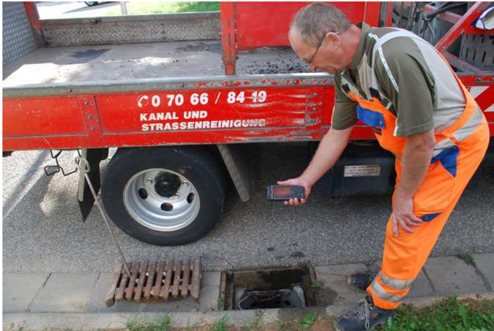
Abb. 1: Mit der Software 4mobile Kanalreiner von ICS International wird die Einsatzdokumentation bei Inspektion, Reinigung und Reparatur von Sinkkästen mobil und IT-gestützt durchgeführt. Dienstleister als auch auftraggebende Kommunen profitieren von schnelleren Abläufen, deutlicher Prozesstransparenz und nachhaltigen Kosteneinsparungen.

Nachstehendes Bildmaterial in Druckauflösung erhalten Sie gern auf Anfrage an marketing@ics-ident.de .