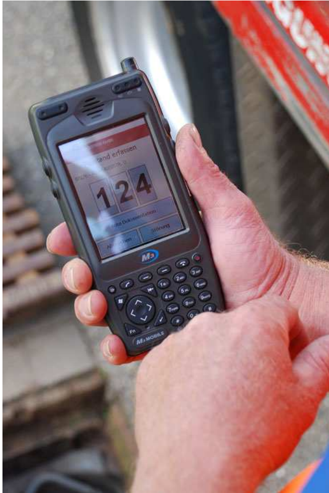
Abb. 3: Kanalreiniger arbeiten im Außendienst mit der Software 4mobile Kanalreiniger von ICS und multifunktionalen Handterminals, wie hier dem M3 Sky, deutlich effizienter. Funktionen, wie unter anderem mobile Auftragsübermittlung und -dokumentation, GPS-Schachterfassung sowie Fotobeleg, stellen Zeiteinsparungen und Produktivitätssteigerungen sicher.